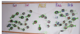
Unsere Fische mit Fotos werden mehr, aber noch sind nicht alle 'erfasst' :-)

Ein Ausblick für die nächsten 3 Mo- nate liegt bei. Änderungen sind mög- lich - dies bitten wir zu entschuldigen.