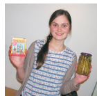
Unsere Bohnanza- siegerin

Gute Zusammenarbeit mit anderen Institutionen