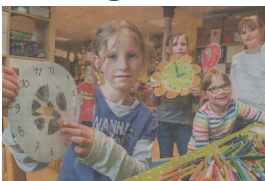
Wir sind in der Presse: mit unserem Projekt 'Uhr herstellen'