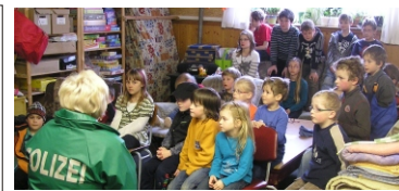
Theoretische Unterweisung oben; Praktische Tipps unten