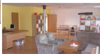
Rechts: unser großer und freundlicher Begegnungsraum

Vom 16.-17. Mai erfolgte unser offizieller Umzug in die neuen Räume. Endlich gehört der Kellerraum der Geschichte an. Nun 'residieren' wir in sonnendurchfluteten, hellen und gemütlichen Räumen. Wir freuen uns riesig darüber!!! (Mehr hierzu auf Seite 3)