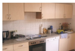
Links: unsere neue Küche

Nachdem wir Ende April unsere neue Küche aufbauen konnten, erfolgte am 7. Mai der Aufbau unserer neuen und/oder gesponsorten Möbel in den neuen Räumen - dazu mehr auf Seite 3!!!